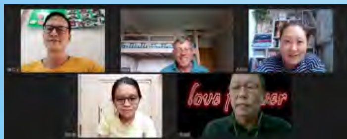
齊明道牧師授「禱告、醫治、釋放」